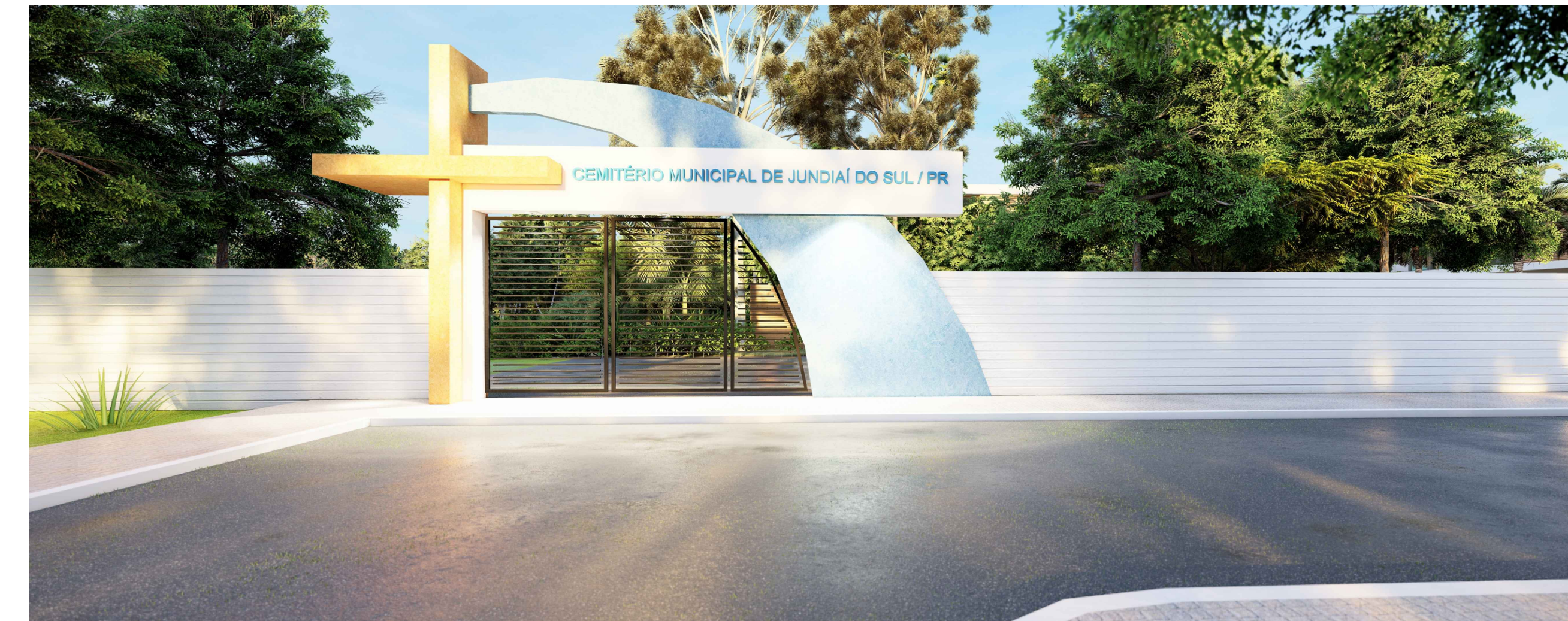
PERSPECTIVA - SEM ESCALA