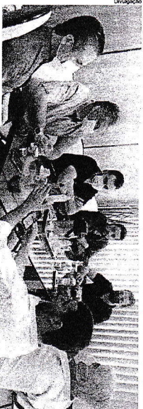
Gestores que fazem parte do Conselho Intermunicipal para o Desenvolvimento da Bacia do Paranapanema (C7), discutiram com o parlamentar interesses em comum